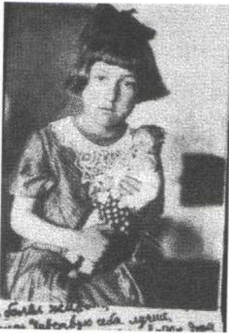
Девочка блокадного города

...пяtilетних инвалидов, Игру смеющихся калек... Не дай вам Бог такое видеть, Такое вынести Вовек.